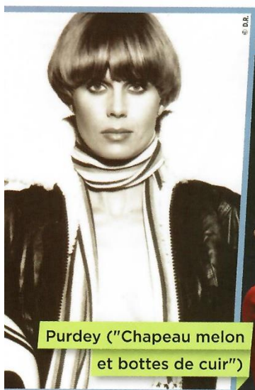
Purdey ("Chapeau melon et bottes de cuir")